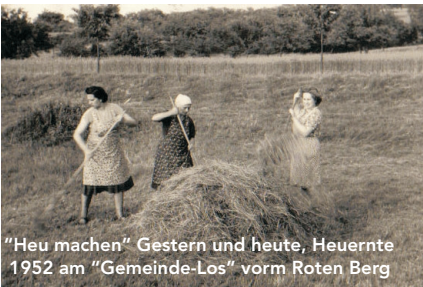
"Heu machen" Gestern und heute, Heuernte 1952 am "Gemeinde-Los" vorm Roten Berg

Nach der Renaturierung liegt nun ein Schwerpunkt der Schutzgebietspflege auf den feuchtgebundenen Lebensräumen.