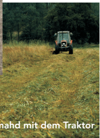
Heumahd mit dem Traktor